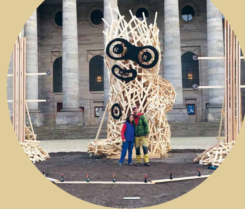
15.00–17.45 Uhr Kunst am Holz mit Pialetto: www.pialetto.ch