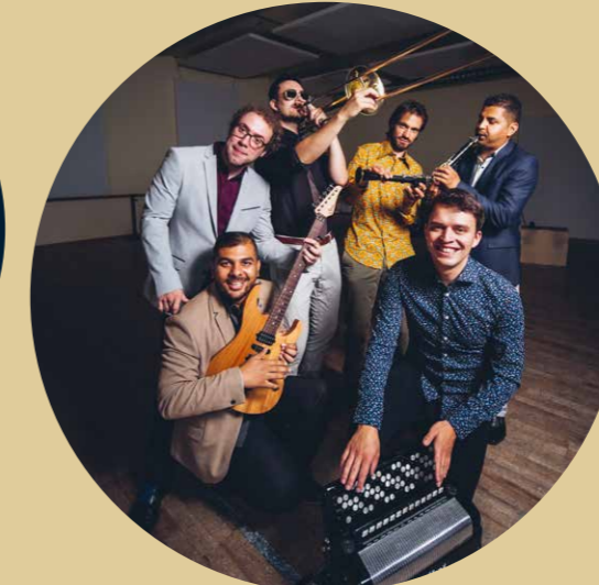
21.30–22.30 Uhr Sebass, die Band, bei der das Tanzbein zu Balkan und Romani Music geschwungen wird: www.sebass.ch