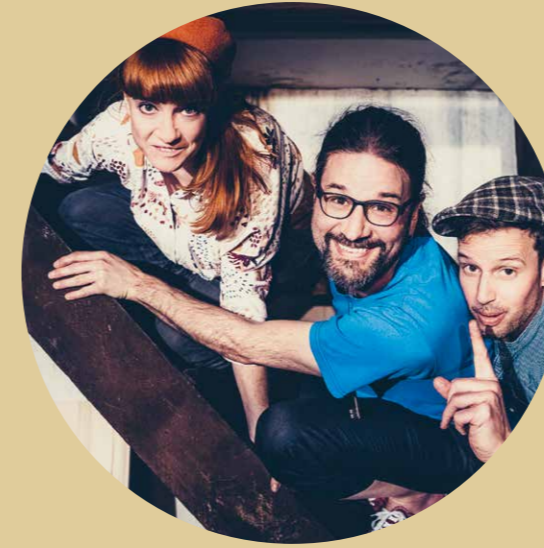
15.00–17.00 Uhr Die Band Silberbüx lässt die Kinderherzen höherschlagen: www.silberbuex.ch