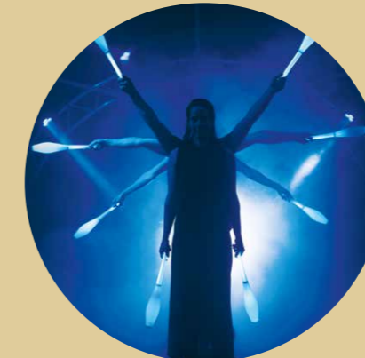
20.30–21.00 Uhr Jonglissimo mit der Show Radiance – Lichter der Natur: www.jonglissimo.com