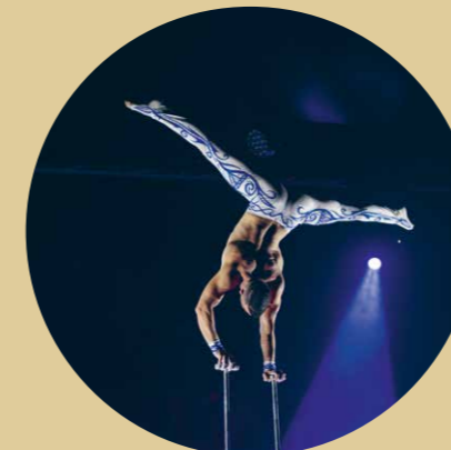
20.30–21.00 Uhr Krasimir Vasov, die hohe Kunst der Balance: www.instagram.com/krasimir_vasov/